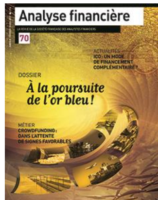
Edition 70 (janvier-mars 2019)