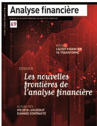
Edition 69 (octobre-décembre 2018)

Le dossier Métier s'est intéressé au capital-risque ( venture en anglais), une forme particulière de capital investissement consistant à financer des entreprises, nouvellement créées et évoluant dans des secteurs de pointe, par le biais de capitaux propres. Le montant record de collecte sur l'année 2018 (11,4 milliards d'euros, + 11% par rapport à 2017) devait faire l'objet d'explications. C'est pourquoi, la parole a été donnée aux gestionnaires de fonds et aux entrepreneurs.