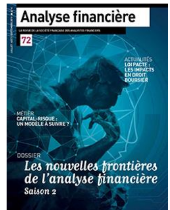
Edition 72 (juillet-septembre 2019)