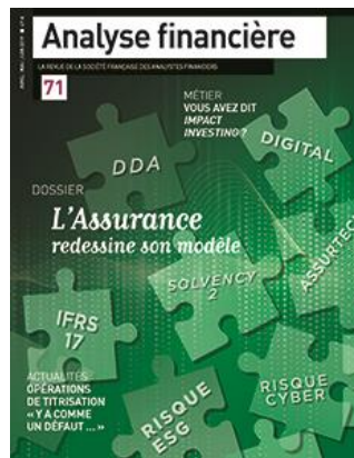
Edition 71 (avril-juin 2019)